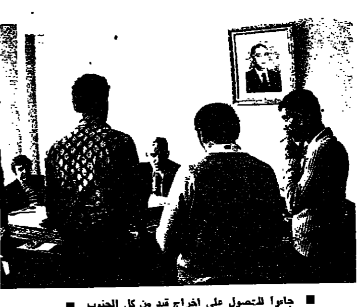
جاوا للحصول على اخراج قيد من كل الجنوب